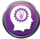
INNOVATION UND LEIDENSCHAFT