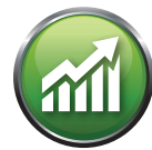
INVESTITION IN UNSERE ZUKUNFT