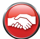
IMPEGNO NEI CONFRONTI DEL CLIENTE