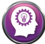
INNOVATION AND PASSION