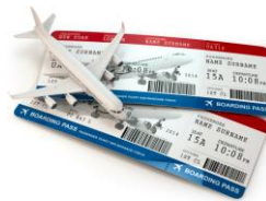
다음과 같은 접대: 식사 음료 호텔 숙박 여행 숙소 제공 교통비