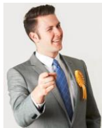
다음과 같은 부탁: 자재, 장비 등의 사용 시설의 사용 대출 일자리 약속 무료 상품 약속