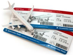
다음과 같은 접대: 식사 음료 호텔 숙박 여행 숙소 제공 교통비