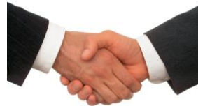
간접적인 제공 예: 정부 공무원의 가족에 대한 장학금 지급