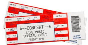
엔터테인먼트, 예: 콘서트 티켓 스포츠 경기 티켓 여행