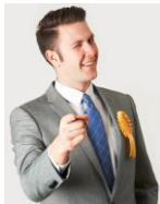
다음과 같은 부탁: 자재, 장비 등의 사용 시설의 사용 대출 일자리 약속 무료 상품 약속