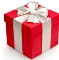
선물 상품권 상품 카드 자선 기부 정치 현금