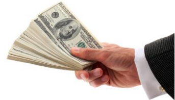
현금 가격 할인 보너스 리베이트

‘금전적 가치가 있는 물품’ 을 제공하는 것은 뇌물입니다. 뇌물은 단지 현금 지불 이외의 광범위한 정의를 가지고 있습니다.